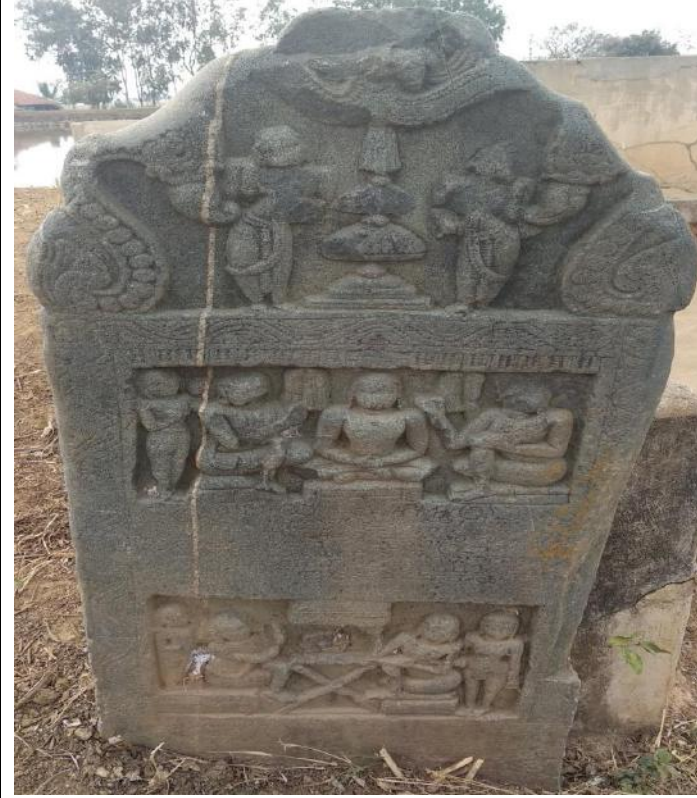
ಸುತಕೋಟ, ತಾಲೂಕು ಹಿರೇಕೆರೂರು