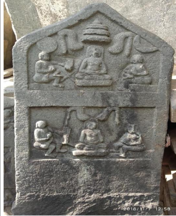
ಯಳವಟ್ಟು ತಾಲೂಕು ಹಾನಗಲ್ಲು