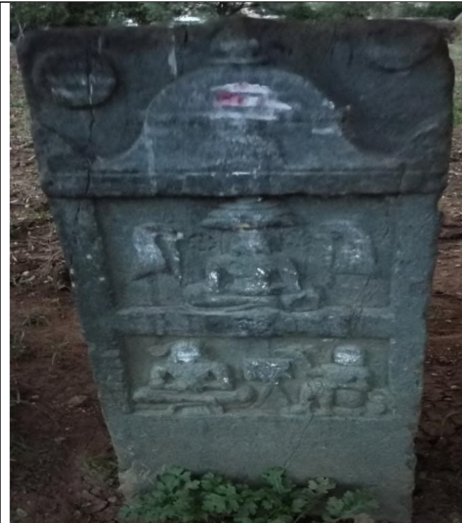
ಕಡಕೋಳ ತಾಲೂಕು ಸವಣೂರು