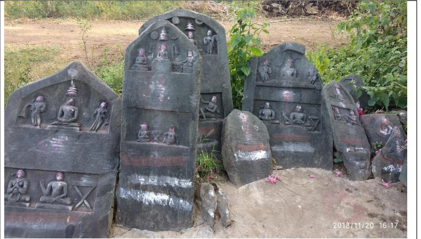
ಹೆರೂರು, ತಾಲೂಕು ಹಾನಗಲ್ಲು