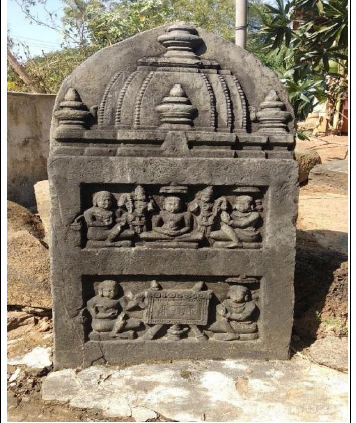
ಮಂತಗಿ ತಾಲೂಕು ಹಾನಗಲ್ಲು